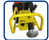
Nouveau: Plaque de pousser d'arrêt en acier