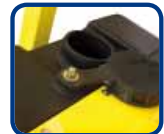
Réservoir d'eau 47 l