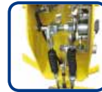
Arrêt et commande de sécurité améliorée.