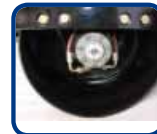
Moteur hydraulique SAUER DANFOSS